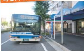
● 阪神電鉄・御影駅前停留所 (六甲アイランド港行き)