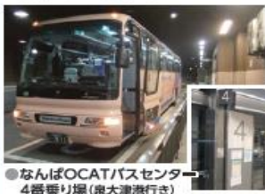
● なんばOCATバスセンター 4番乗り場 (泉大津港行き)