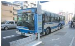
● JR住吉駅前停留所 (六甲アイランド港行き)