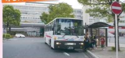
● JR小倉駅新幹線口停留所 (新門司港行き)