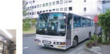
● 南海電鉄・泉大津駅前西口停留所 (泉大津港行き)