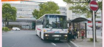
● JR小倉駅新幹線口停留所 (新門司港行き)