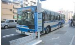
● JR住吉駅前停留所 (六甲アイランド港行き)