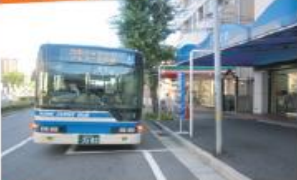
● 阪神電鉄・御影駅前停留所 (六甲アイランド港行き)