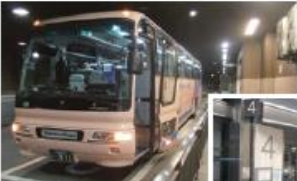
● なんばOCATバスセンター 4番乗り場 (泉大津港行き)