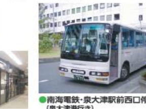
● 南海電鉄・泉大津駅前西口停留所 (泉大津港行き)