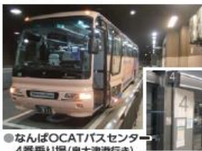
● なんばOCATバスセンター 4番乗り場 (泉大津港行き)