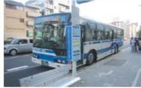
● JR住吉駅前停留所 (六甲アイランド港行き)