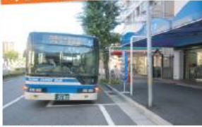
● 阪神電鉄・御影駅前停留所 (六甲アイランド港行き)