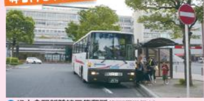
● JR小倉駅新幹線口停留所 (新門司港行き)