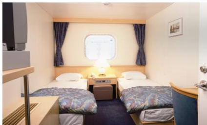
ステート洋室(イメージ)