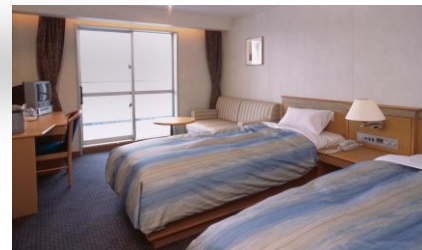
専用テラス付デラックスA(イメージ)

○旅行代金に含まれるもの 新日本海フェリー往復乗船代(ステートまたはデラックス)・往復乗用車航送代(5m未満1台)、ホテルルートイン秋田土崎(ツインルーム・食事なし)orホテルパールシティ秋田川反(ツインルーム・食事なし)