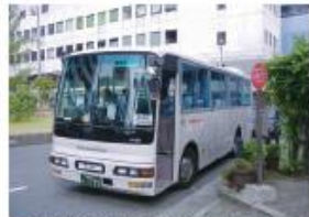
●南海電鉄・泉大津駅前西口停留所 (泉大津行き)