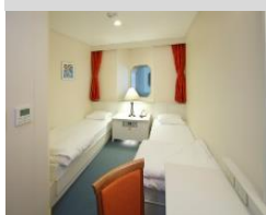
敦賀～苫小牧東航路

ステートルームB(個室) (2～4名定員 画像は2名用) ※トイレ・冷蔵庫はありません