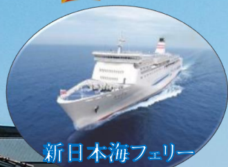
新日本海フェリー