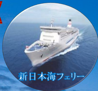
新日本海フェリー