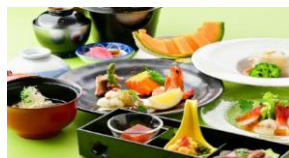
「夏の思い出彩りディナー」