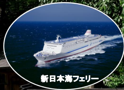
新日本海フェリー