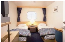
苫小牧東→新潟航路 ステートルームB(個室) (2~4名定員 画像は2名用) トイレ・シャワー・冷蔵庫なし