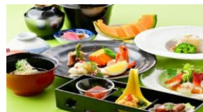
「夏の思い出彩りディナー」