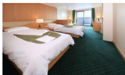
デラックスA(個室) (2~3名定員 画像は2名洋室) 専用テラス・冷蔵庫・ ユニットバス (トイレ・バス・洗面所)付 *デラックスBは苫小牧東発着 のみで専用テラスなし。