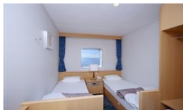
小樽→新潟航路 ステートルームA(個室) (2~4名定員 画像は2名用) トイレ・シャワー・冷蔵庫あり