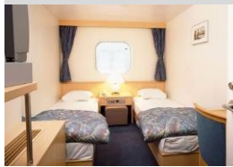
新潟～苫小牧東航路

ステートルームB(個室) (2～4名定員 画像は2名用) シャワー・トイレ・冷蔵庫なし