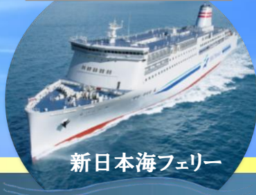
新日本海フェリー