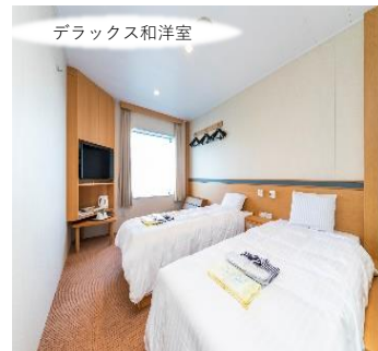
デラックス和洋室