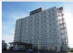
ホテルルートイン秋田土崎

ホテルルートイン秋田土崎または、 ホテルパールシティ秋田川反 ツイン(1泊食事なし)