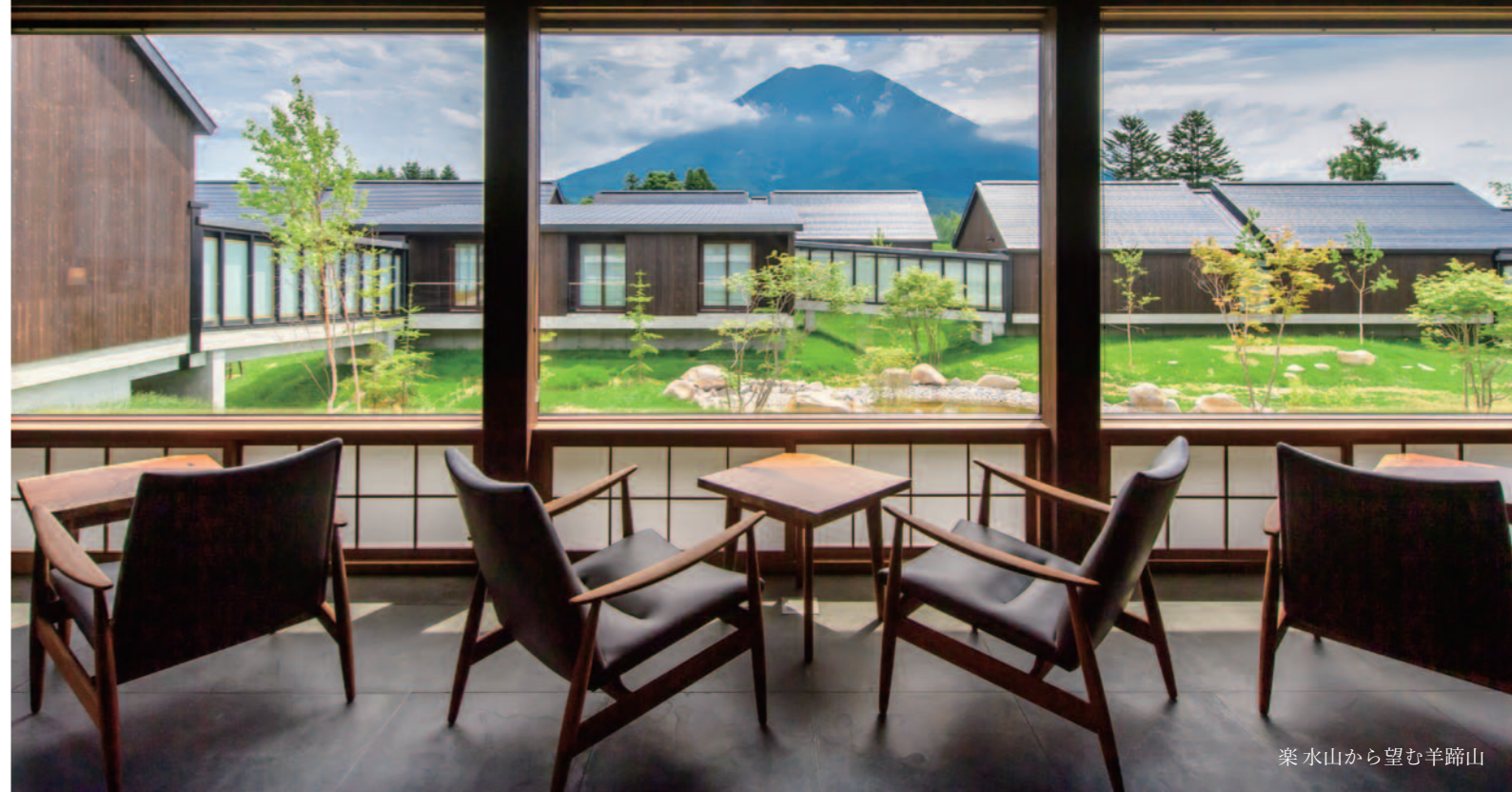
楽水山から望む羊蹄山