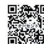
オーセントホテル小樽