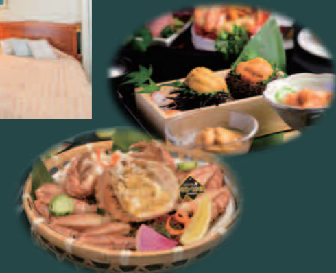
北海道産の食材にこだわったディナー (イメージ)