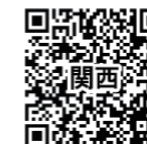
ヴィーナストラベル