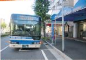
● 阪神電鉄・御影駅前停留所 (六甲アイランド港行き)