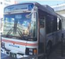
● 和泉府中駅前停留所 (泉大津港行き)