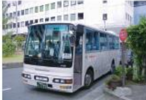
● 南海電鉄・泉大津駅前西口停留所 (泉大津港行き)