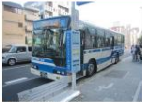
● JR住吉駅前停留所 (六甲アイランド港行き)