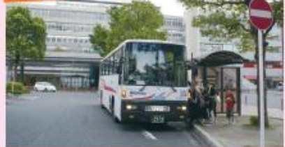
● JR小倉駅新幹線口停留所 (新門司港行き)