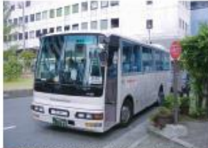
● 南海電鉄・泉大津駅前西口停留所 (泉大津港行き)