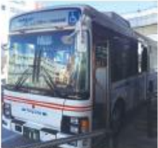
● 和泉府中駅前停留所 (泉大津港行き)