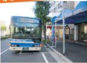
● 阪神電鉄・御影駅前停留所 (六甲アイランド港行き)