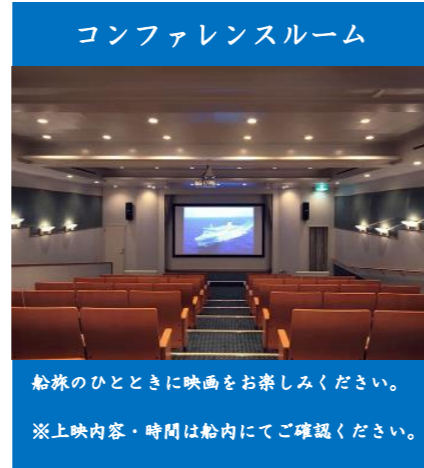
写真は全てイメージです。