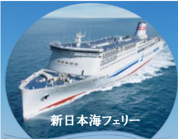
新日本海フェリー