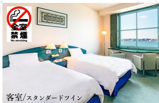
客室/スタンダードツイン