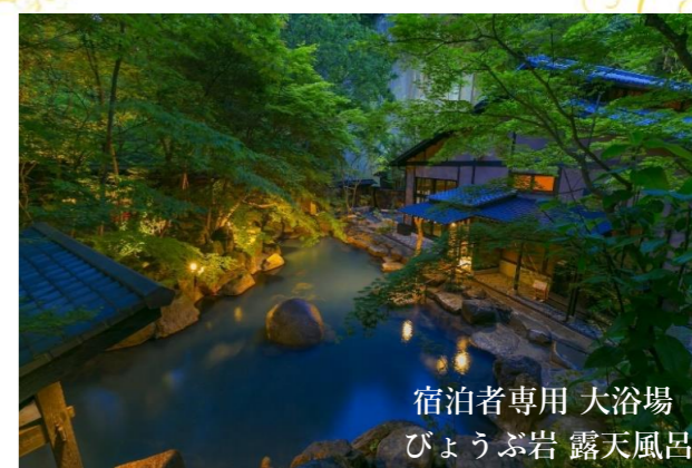
宿泊者専用 大浴場 びょうぶ岩 露天風呂