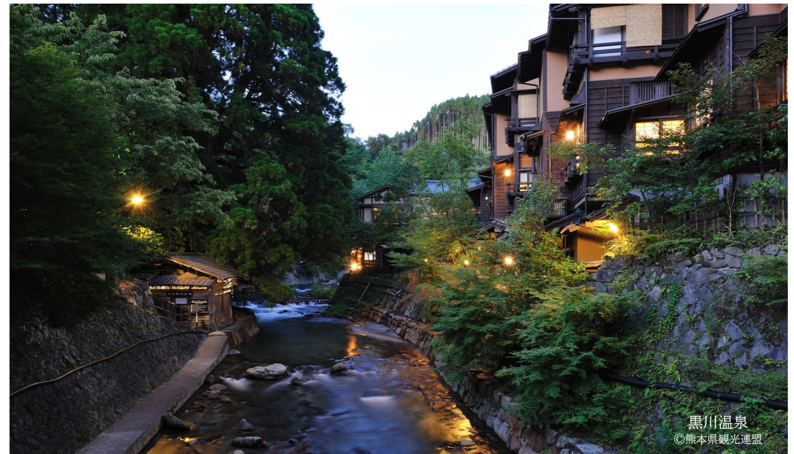
黒川温泉