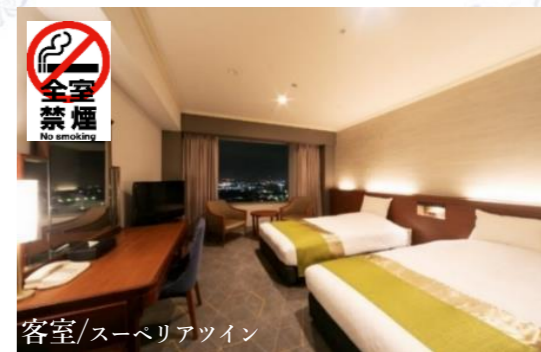
客室/スーベリアツイン