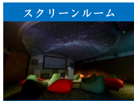
スクリーンルーム

爽やかな海風を感じられる贅沢な露天風呂やサウナも楽しめる大浴場です。また、24時間いつでもご利用可能なシャワー室も完備しております。