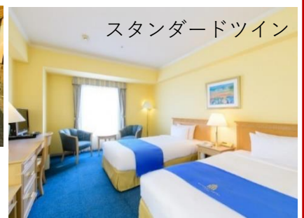
スタンダードツイン

ご朝食希望の方は、別途おひとり様2,550円(税込) 現地申込み・お支払いとなります。 ご宿泊・ご夕食時 駐車料金無料♪