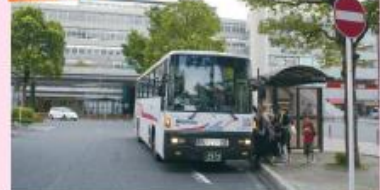
● JR小倉駅前幹線口停留所(新門司港行き)