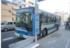
● JR住吉駅前停留所 (六甲アイランド港行き)