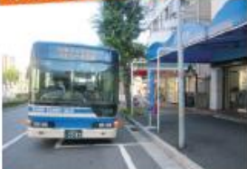
● 阪神電鉄・御影駅前停留所 (六甲アイランド港行き)