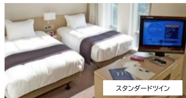
スタンダードツイン

港からホテルまでお車で約10分 JR横須賀駅まで徒歩約8分 京急線汐入駅まで徒歩約1分 駐車料金 入庫から24H/1,600円