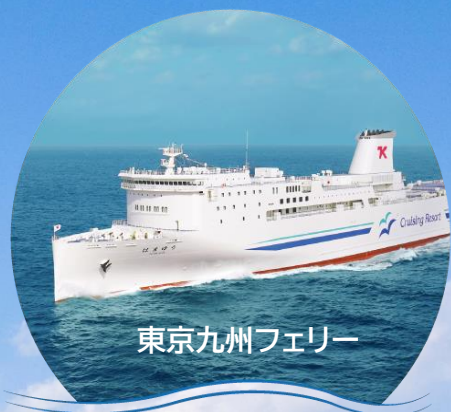
東京九州フェリー