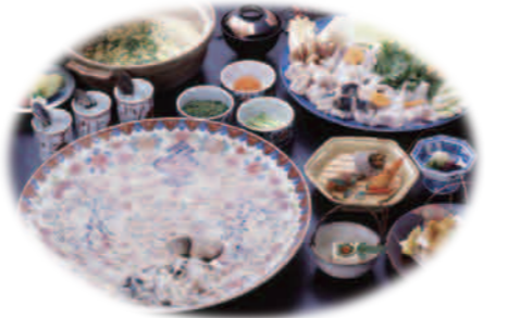
※画像は全てイメージです。