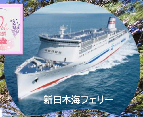
新日本海フェリー