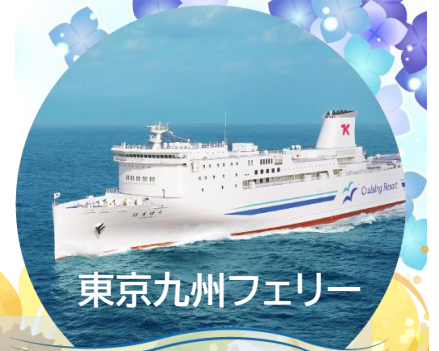
東京九州フェリー