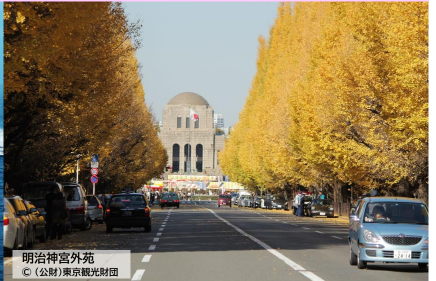
明治神宮外苑