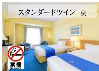
スタンダードツイン一例