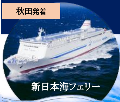
新日本海フェリー