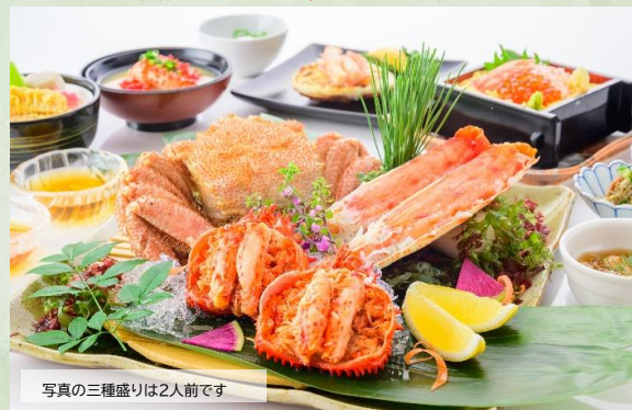
写真の三種盛りは2人前です

ツーリスト・ステートプラン共通のご案内 ※オーセントホテル小樽のご夕食は、ホテルレストランにてご用意致します。「17:30開始」と「19:30開始」の2回転となります。