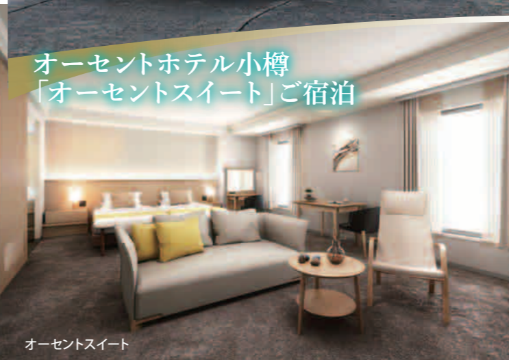
オーセントホテル小樽「オーセントスイート」ご宿泊

歴史とロマンの港町“小樽”、そして大自然あふれる“ニセコ”で感謝の思いを込めた贅を尽くしたプランをお楽しみください。