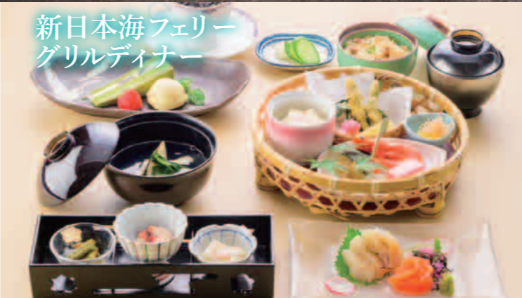
新日本海フェリー グリルディナー