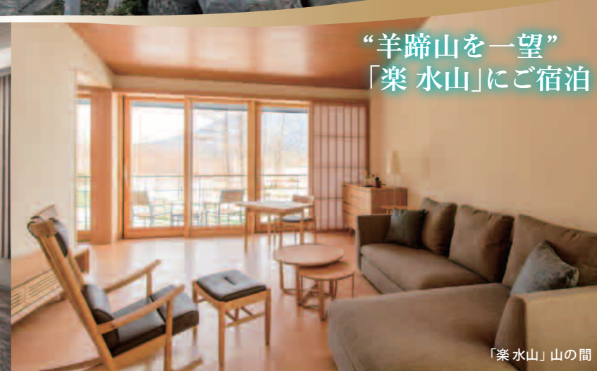
“羊蹄山を一望”「楽水山」にご宿泊