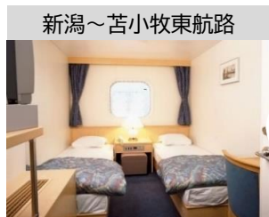
新潟~苫小牧東航路