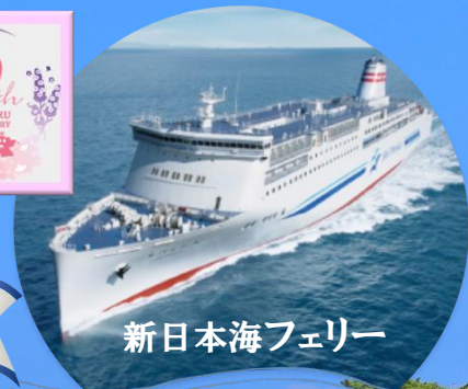
新日本海フェリー