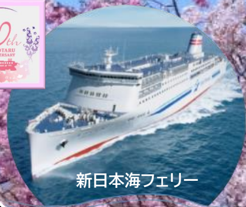
新日本海フェリー