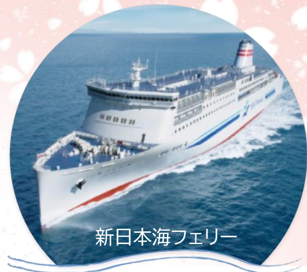
新日本海フェリー