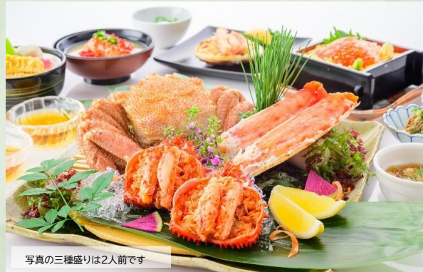
写真の三種盛りは2人前です