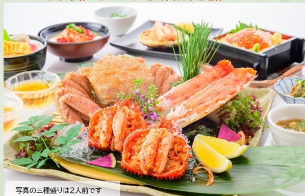
写真の三種盛りは2人前です