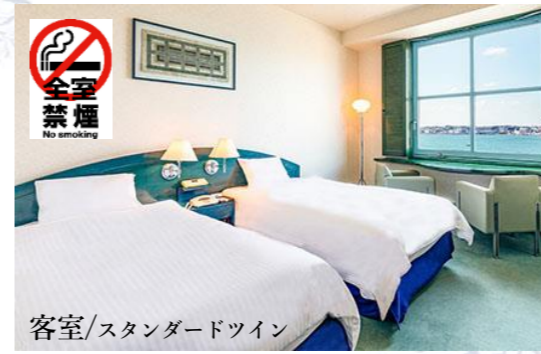
客室/スタンダードツイン ※宿泊税 現地払い 1名様200円