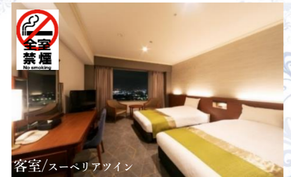
客室/スーベリアツイン