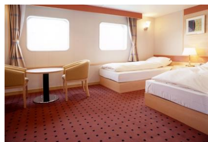
* 特等船室(バス・トイレあり)