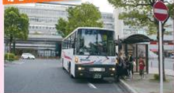
●JR小倉駅新幹線口停留所 (新門司港行き)