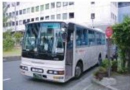
●南海電鉄・泉大津駅前西口停留所 (泉大津港行き)