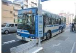
●JR住吉駅前停留所 (六甲アイランド港行き)