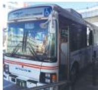
●和泉府中駅停留所 (泉大津港行き)