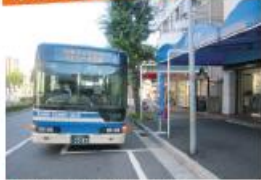
●阪神電鉄・御影駅前停留所 (六甲アイランド港行き)