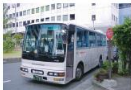
●南海電鉄・泉大津駅前西口停留所 (泉大津港行き)