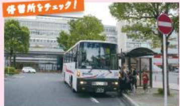
●JR小倉駅新幹線口停留所 (新門司港行き)