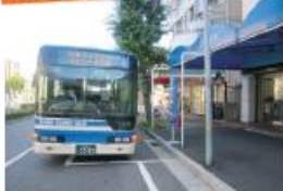
●阪神電鉄・御影駅前停留所 (六甲アイランド港行き)