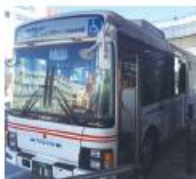
●和泉府中駅前停留所 (泉大津港行き)