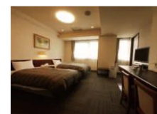
ホテルルートイン第2長野