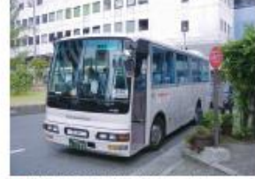
● 南海電鉄・泉大津駅前西口停留所 (泉大津港行き)