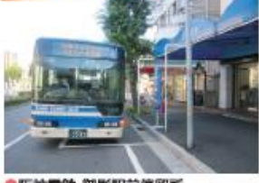
● 阪神電鉄・御影駅前停留所 (六甲アイランド港行き)