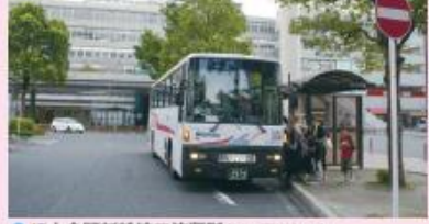
● JR小倉駅新幹線口停留所 (新門司港行き)