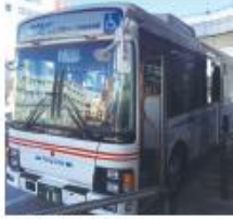
● 和泉府中駅前停留所 (泉大津港行き)