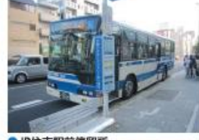
● JR住吉駅前停留所 (六甲アイランド港行き)