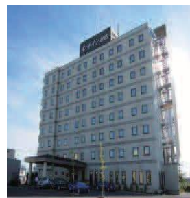
ホテルルートイン秋田土崎