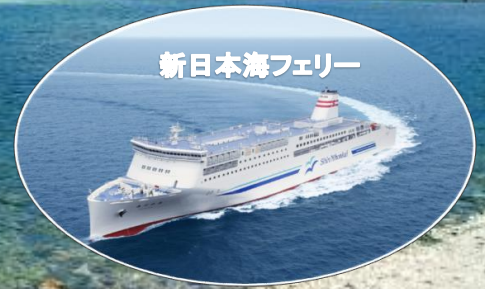
新日本海フェリー