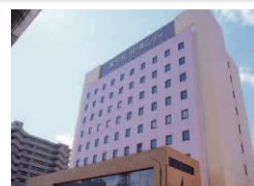
ホテルパールシティ秋田川反