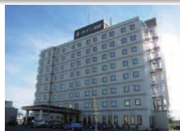
ホテルルートイン秋田土崎

ホテルルートイン秋田土崎または、 ホテルパールシティ秋田川反 ツイン(1泊食事なし)