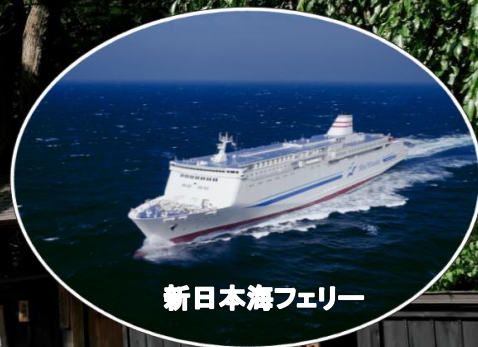
新日本海フェリー

設定日 2022年9月1日(木) 出発～11月30日(水) 帰着 行程は最大14日間まで延長可能!