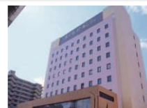
ホテルパールシティ秋田川反