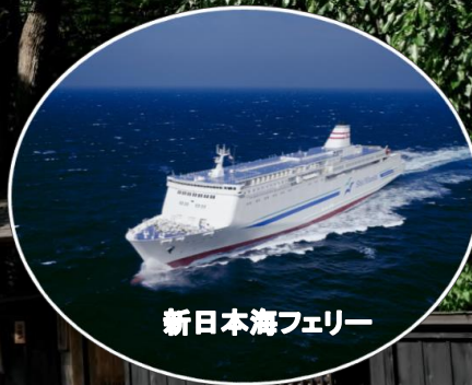
新日本海フェリー