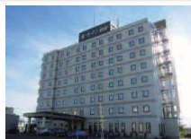
ホテルルートイン秋田土崎

ホテルルートイン秋田土崎または、 ホテルパールシティ秋田川反 ツイン(1泊食事なし)