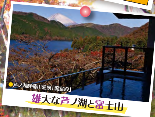
●芦ノ湖畔蝸川温泉「龍宮殿」