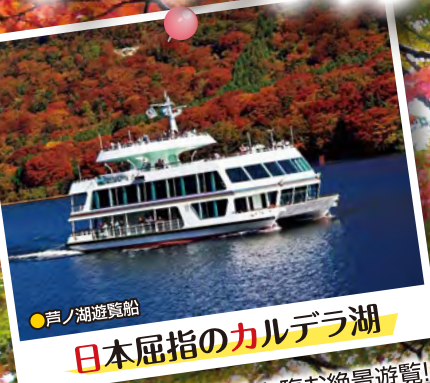
●芦ノ湖遊覧船 日本屈指のカルデラ湖