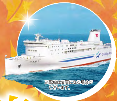
※配船は変更になる場合がございます。