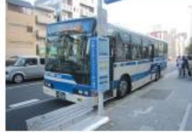
● JR住吉駅前停留所 (六甲アイランド行き)