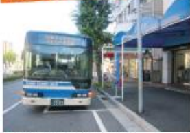
● 阪神電鉄・御影駅前停留所 (六甲アイランド行き)