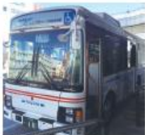
● 和泉府中駅前停留所 (泉大津行き)