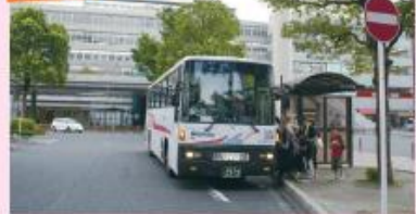
● JR小倉駅新幹線口停留所 (新門司港行き)