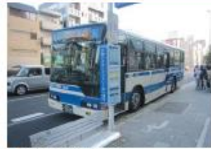
●JR住吉駅停留所 (六甲アイランド港行き)