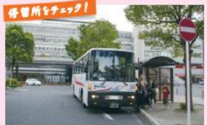
●JR小倉駅新幹線口停留所 (新門司港行き)