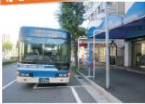
●阪神電鉄・御影駅前停留所 (六甲アイランド港行き)